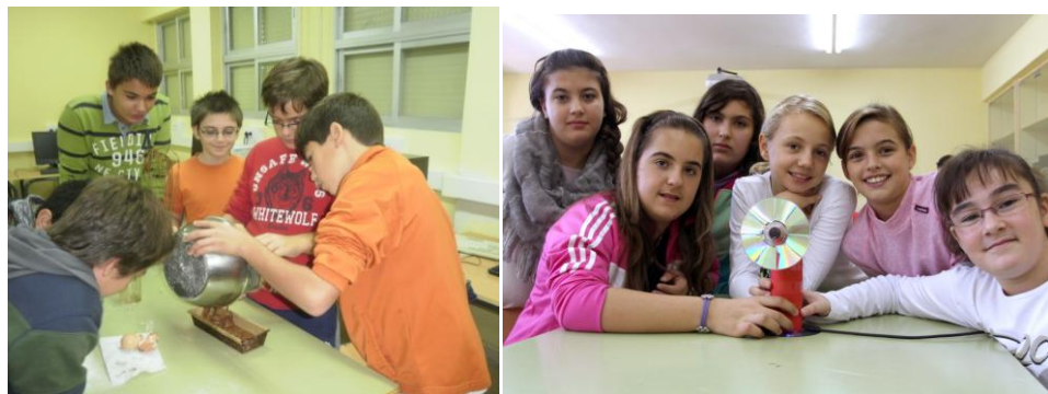
Foto Talleres CEIP Pablo Picasso

Los estereotipos de género reflejan las creencias populares sobre actividades, roles, rasgos o atributos que caracterizan y distinguen a las mujeres de los hombres, eliminarlos es importante para lograr la igualdad.