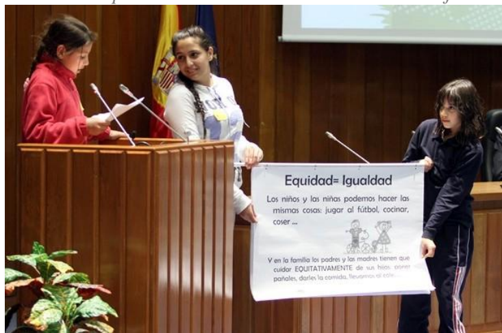
Foto participantes ATZ Injucam

Los seres humanos somos iguales, con igual libertad para desarrollar habilidades personales y hacer elecciones sin estar limitados por estereotipos, roles y prejuicios. Nuestros derechos, responsabilidades y oportunidades no dependen de haber nacido hombre o mujer.