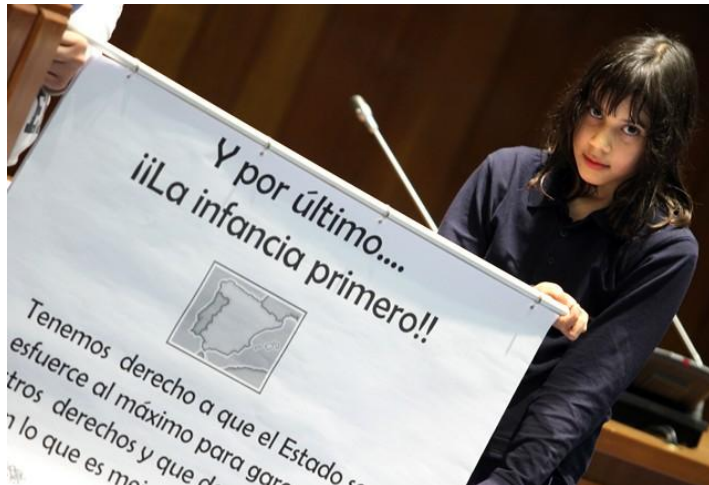
Foto Día de la Infancia 2012 Participantes ATZ - Injucam