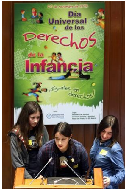
Foto Participantes Laviana, Consejo de Asturias

En participación infantil se recogen ideas en torno a la libertad de opinión y expresión de niñas, niños y adolescentes.